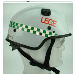
Lege eller sykepleier