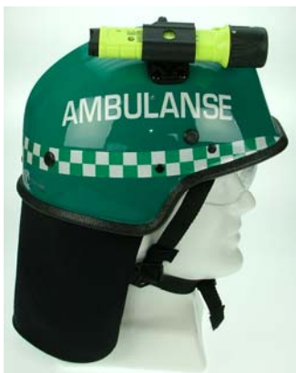
Hjelmen kan suppleres med lykt. PARAT PX1 LED