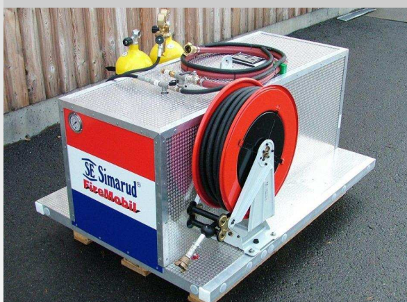
SIMARUD FIREMOBIL MED "POK" STRÅLERØR I AKSJON!