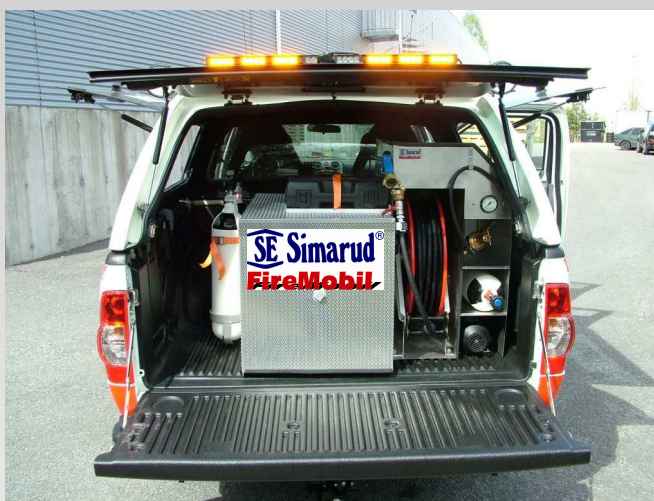
SIMARUD FIREMOBIL MED "PROPAK" SKUMSYSTEM I AKSJON!