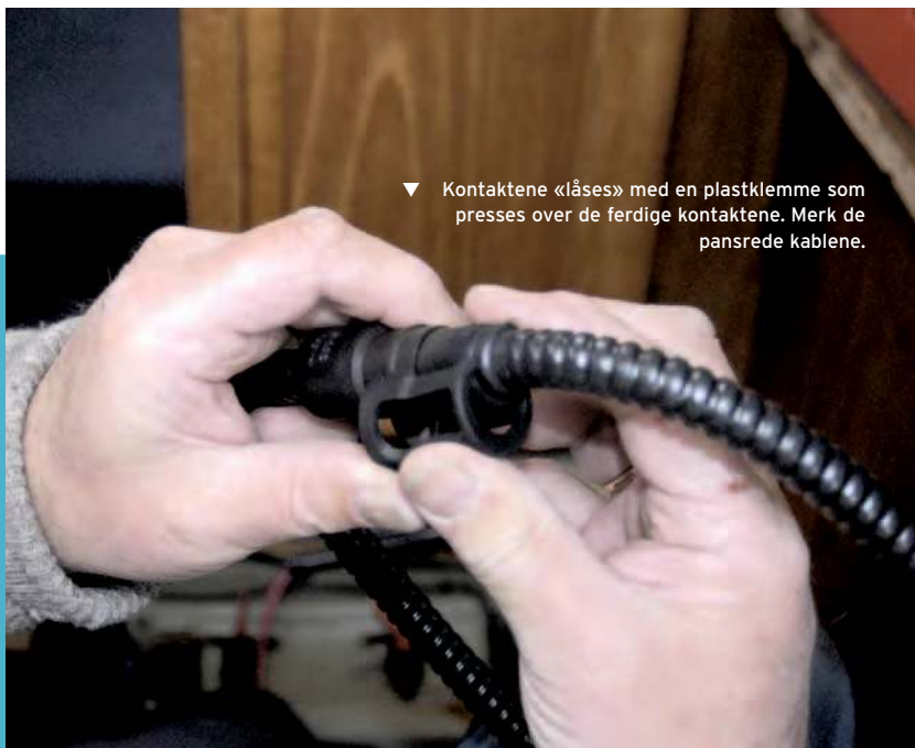
▼ Kontaktene «låses» med en plastklemme som presses over de ferdige kontaktene. Merk de pansrede kablene.

► Den sorte ladekabelen og den gul-grønne jord-kabelen (fra el-sentralen) festes til batteriminus. Den tykke røde ladekabelen, og den tynne røde sense-kabelen festes til batteriplus.