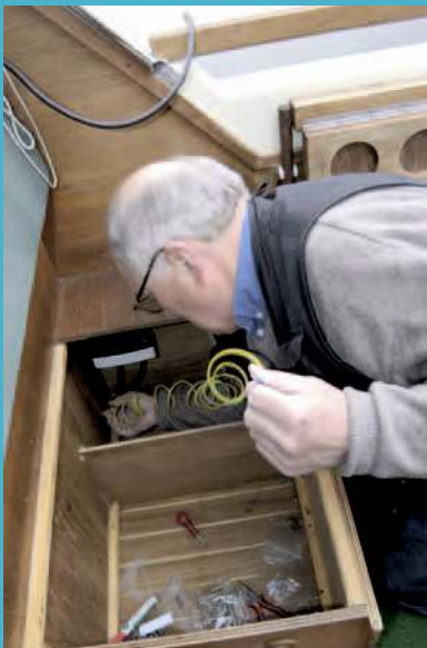
Den gulgrønne kabelen skal strekkes fra el-sentralen til minus-polen på batteriet. ▲