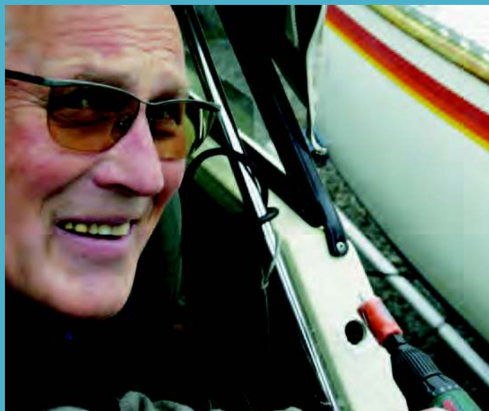
▲ - Det er alltid med blandede følelser jeg borrar hull i 20 år gammel båt.

OM CALIX: Båtpakkene finnes i forskjellige versjoner som varierer med størrelsen på batterilader, antall og spredning av stikkontakter, lengde på de ferdigtilpassede kablene osv.