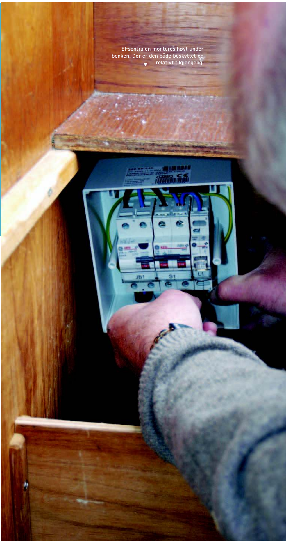
El-sentralen monteres høyt under benken. Der er den både beskyttet og relativt tilgjengelig. ▼